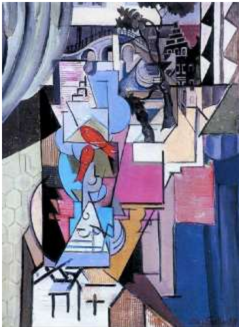
Emil Filla – Prague Stay