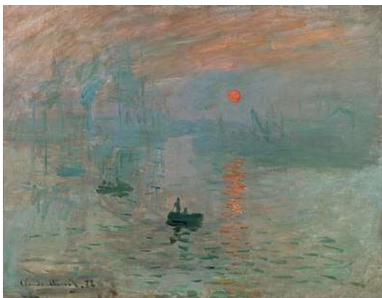
Claude Monet – Imprese: východ slunce