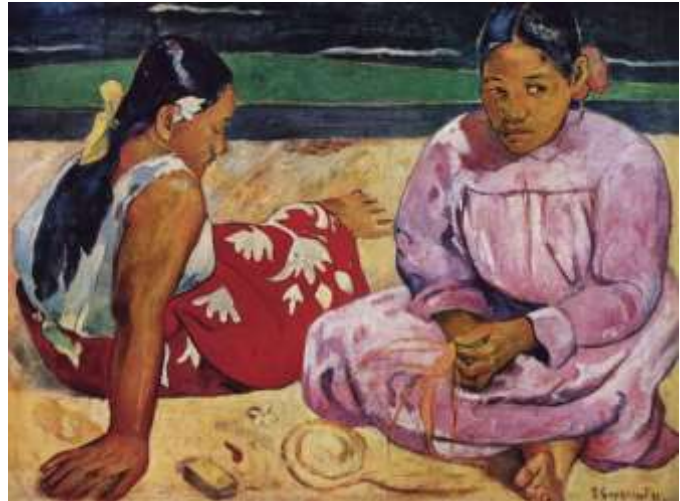
P. Gauguin – Tahiťanky na pláži