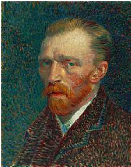
Vincent van Gogh – autoportrét