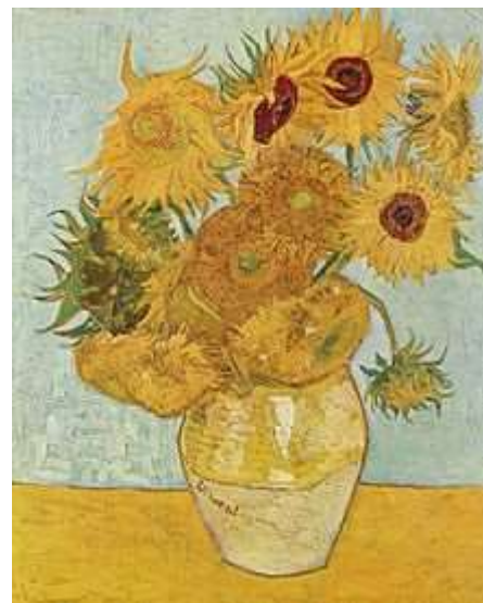
Vincent van Gogh – Slunečnice

https://www.youtube.com/watch?v=GzMkLvPOTrc - video