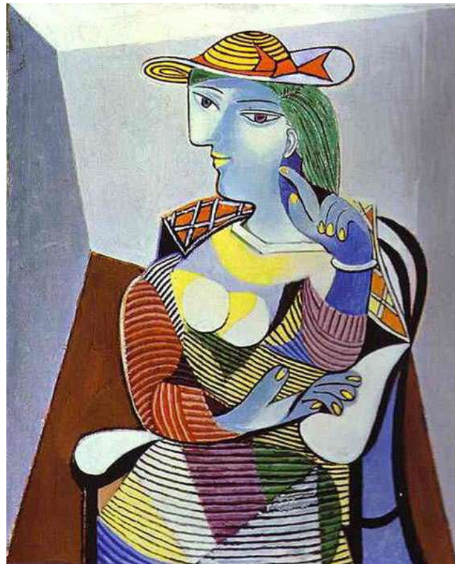
Pablo Picasso - Portrét Marie – Therese Walther