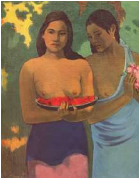
P. Gauguin – Dívky s květy manga